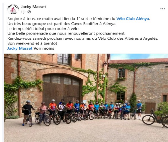
Clin d'oeil du V.C.Alénya