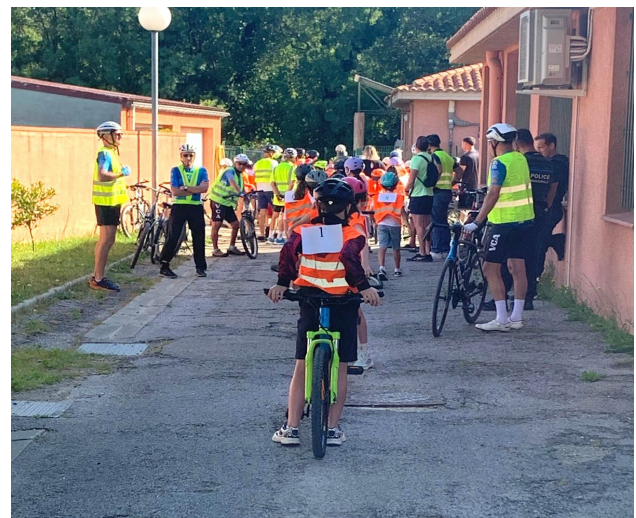
Paré pour encadrer les enfants de l'école Molière