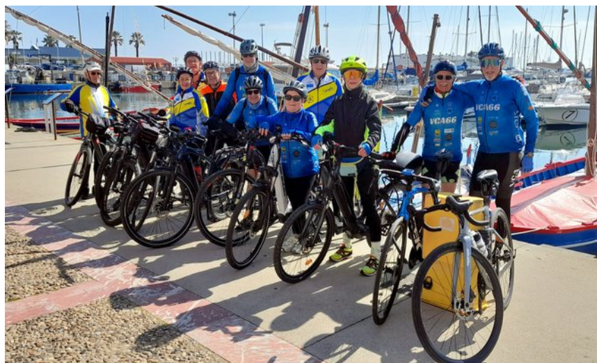
Le groupe Balade lors de la sortie du samedi 21 mars.

Compte tenu du passage à l'heure d'été ce dimanche 29 mars, pour l'instant, en ce début du mois d'avril, nous ne modifions pas encore les horaires des départs des différents groupes. Au moins, jusqu'à la mi-avril, les groupes ROUTE partiront toujours à 8h30 de la mairie d'Argelès (ce qui correspond à 7h30 aujourd'hui avant le changement d'heure, le soleil sera encore très bas sur l'horizon) et à 9h00 de Market-Laroque. Si, en concertation avec les responsables de la programmation et les capitaines de route, ces horaires devaient être modifiés à la mi-avril, vous en serez avisé individuellement. Le groupe LOISIR et les Vététistes ne changent rien non plus à leurs programmations horaires. Les rendez-vous des Vététistes sont toujours fixés à 9h tout au long du mois. Il en est de même pour notre nouveau groupe Balade des samedis. Nous (le bureau), nous nous réjouissons du succès rencontré par cette initiative. Les petits circuits faciles que nous proposons répondent aux attentes de nombre d'entre-nous. Reste désormais à étendre ce type de pratique douce sur pistes et chemins en piedmont des Albères. Nous y travaillons.