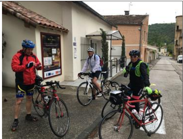
Pas de bulles à Limoux...