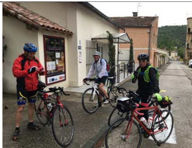
Pas de bulles à Limoux...